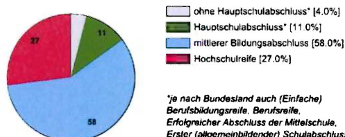
Ausbildungsbereich öffentlicher Dienst